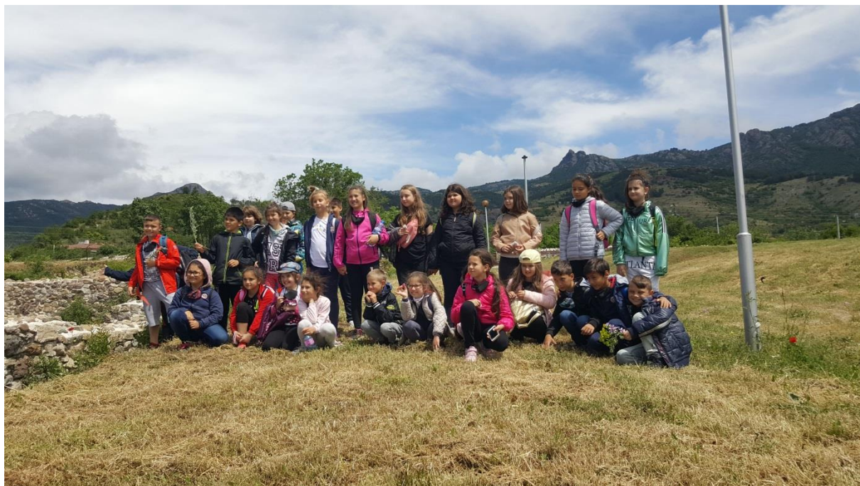
Демонстрации, анимации и стрелба с лък завладя децата.